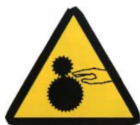
ATENCIÓN: RIESGO DE ATRAPAMIENTO